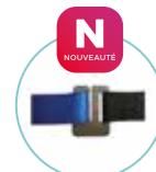
SANGLE AVEC ATTACHE RAPIDE