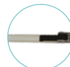
POIGNÉE AMOVIBLE DE TENSION WOOD'LOCK