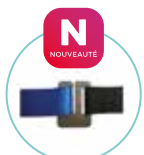
SANGLE AVEC ATTACHE RAPIDE