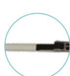
RENFORT PVC POUR PROTECTION DE LA PLAGE