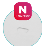
TROU D'ÉVACUATION DES EAUX DE PLUIES