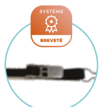
CLIQUET «EASY- ACCROCHAGE RAPIDE